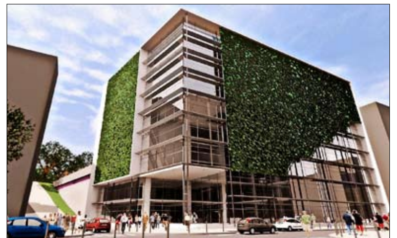
Vista de la entrada desde la calle de Fernando de los Ríos.