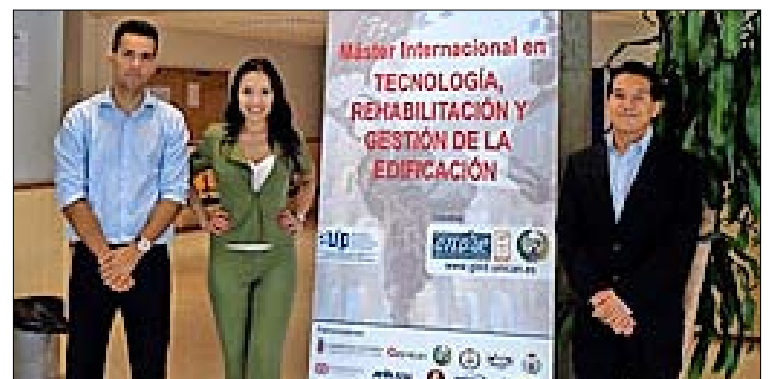
Miembros del grupo del proyecto Ciudad Vertical Santander.

total de 7 proyectos multidisciplinarios, involucrando a 25 de los 41 participantes en el máster. Su temática era tan variable que en la presentación ante el tribunal en junio también se abordó la realización de una ciudad universitaria del norte de España, con el plan de urbanismo para articular las dependencias de la UC con las de la UIMP, la alternativa a las catástrofes naturales con la implantación de viviendas modulares o la rehabilitación de cabañas pasiegas con una filosofía 'passive-house'.