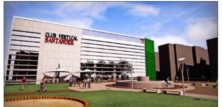
Recreación virtual de la plaza y la entrada desde General Dávila.