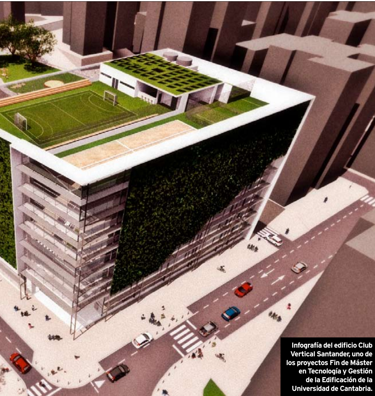
Infografía del edificio Club Vertical Santander, uno de los proyectos Fin de Máster en Tecnología y Gestión de la Edificación de la Universidad de Cantabria.